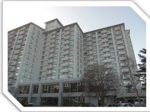
(この図面は概略図で現状と多少異なる場合があります。)